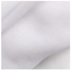
Gardin Capri FR 001 White, 300cm 1801001