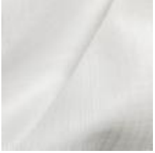
Gardin Capri FR 002 Natural, 300cm 1801007