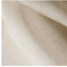
Gardin Capri FR 120 Beige, 300cm 1801002