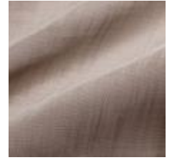
Gardin Capri FR 085 Taupe, 300cm 1801006