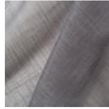
Gardin Capri FR 021 Anthra, 300cm 1801005