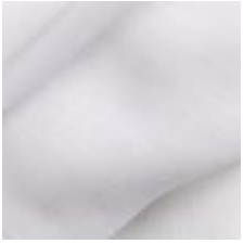
Gardin Capri FR 001 White, 300cm 1801001