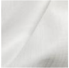
Gardin Capri FR 002 Natural, 300cm 1801007