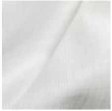
Gardin Capri FR 002 Natural, 300cm 1801007