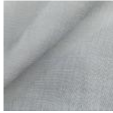
Gardin Capri FR 004 Grey, 300cm 1801004