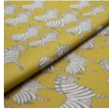
ZEBRA Grå på Lime tryckt på 9999 Cream 9000116