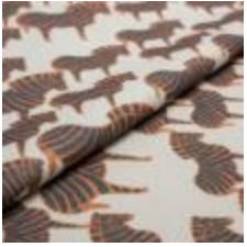
ZEBRA Svart/Orange på 9999 Cream 9000112