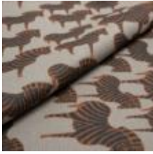
ZEBRA Svart/Orange på 3790 Linen 9000113