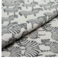
ZEBRA Svart på 9999 Cream 9000114