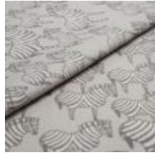
ZEBRA Svart på Grå tryck på 9999 Cream 9000115