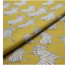
ZEBRA Grå på Lime tryckt på 9999 Cream 9000116