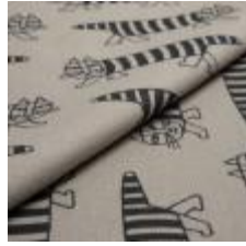
MIKEY Svart på 3790 Linen 9000110