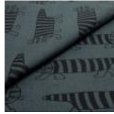
MIKEY Svart på 12086 Dark Soda 9000111