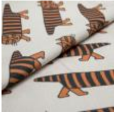
MIKEY Svart/Orange på 9999 Cream 9000109