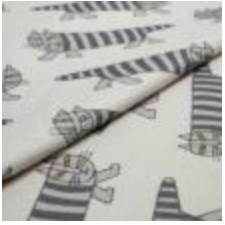
MIKEY Svart/Grå på 9999 Cream 9000108