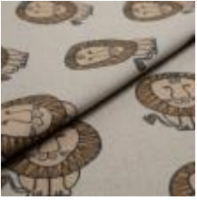
LEO Brun på 3790 Linen 9000101