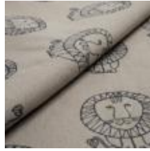
LEO Svart på 3790 Linen 9000103