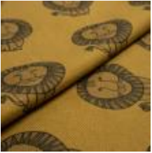
LEO Grå på 12082 Indian gold 9000107