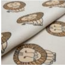
LEO Brun på 9999 Cream 9000102