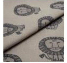
LEO Grå på 3790 Linen 9000106