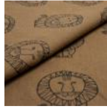
LEO Svart på 2988 Frayed beige 9000104