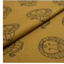
LEO Svart på 12082 Indian gold 9000105