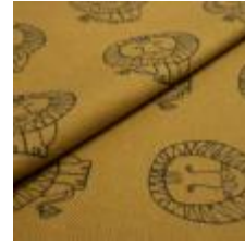
LEO Svart på 12082 Indian gold 9000105