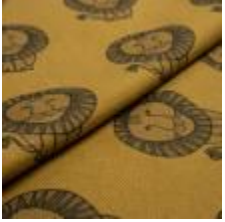
LEO Grå på 12082 Indian gold 9000107