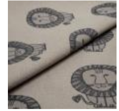
LEO Grå på 3790 Linen 9000106