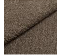
Barnum 8 Medium green 1025013