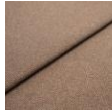
Jazz CS 6 Cinnamon 1013706