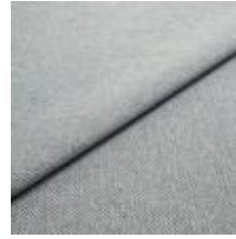
Jazz CS 17 Steel 1013717