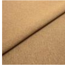
Jazz CS 15 Terra 1013715