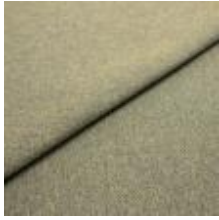
Jazz CS 13 Light green 1013713