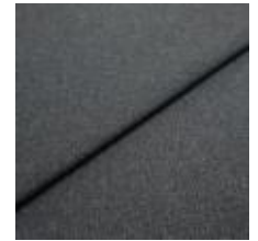
Jazz CS 47 Night 1013747