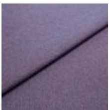
Jazz CS 71 Violet 1013771