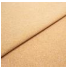
Jazz CS 81 Apricot 1013781