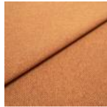
Jazz CS 31 Orange 1013731