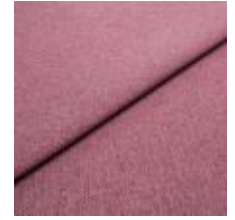
Jazz CS 11 Pink 1013711