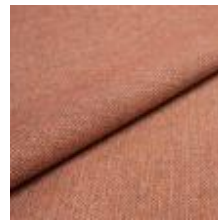
Jazz CS 9322 Apricot 1013755