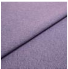
Jazz CS 51 Lavender 1013751