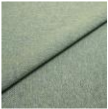
Jazz CS 23 Cool green 1013723