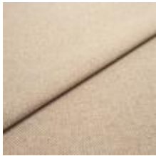
Jazz CS 26 Beige 1013726