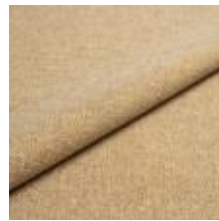
Jazz CS 9203 Oats 1013754