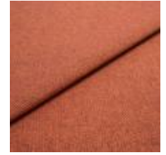
Jazz CS 21 Brick 1013721