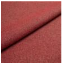
Jazz CS 9412 Marsala 1013757