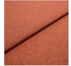
Jazz CS 21 Brick 1013721