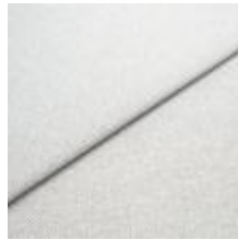
Jazz CS 27 White silver 1013727