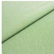
Blues CS II 9701 Green/White 1002156