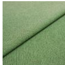
Blues CS II 9711 Green/Linen 1002157