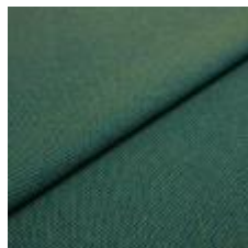
Blues CS II 9716 Green/Petrol 1002162