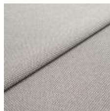
Blues CS II 9168 Taupe/Coconut 1002170