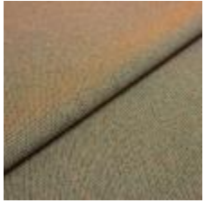
Blues CS II 9306 Orange/Turquoise 1002148