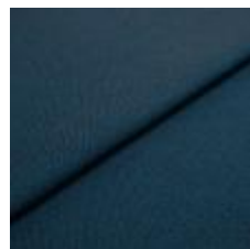
Blues CS II 9608 Petrol/Black 1002169