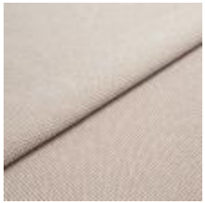
Blues CS II 9122 Beige/Sand 1002142