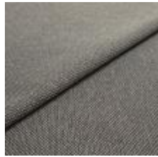
Blues CS II 9202 Brown/Beige 1002144