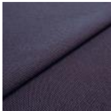
Blues CS II 9604 Blue/Wine 1002155