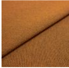
Blues CS II 9302 Orange/Brown 1002149