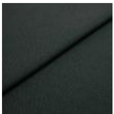
Blues CS II 9207 Bottlegreen/Brown 1002160