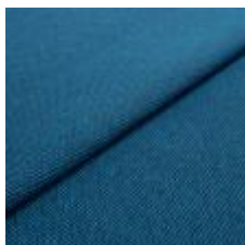
Blues CS II 9616 Blue/Blue 1002167