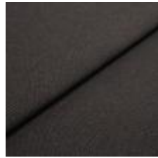
Blues CS II 9222 Coffe/Black 1002146