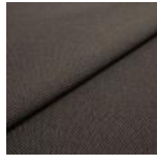
Blues CS II 9233 Brown/Brown 1002145