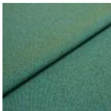
Blues CS II 9706 Green/Turquoise 1002161