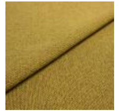
Blues CS II 9317 Gold/Black 1002147