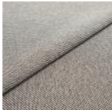
Blues CS II 9822 Brown/Linen 1002143