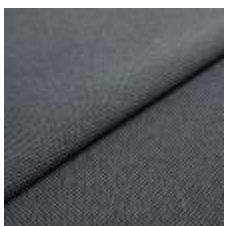
Blues CS II 9818 Antracite/Grey 1002172