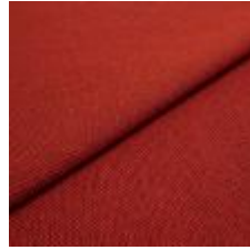
Blues CS II 9404 Red/Red 1002152