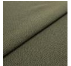
Blues CS II 9737 Olive/Olive 1002159