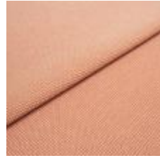
Blues CS II 9301 Orange/White 1002151