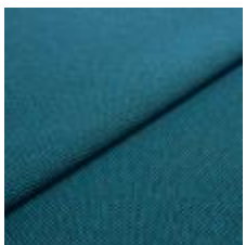
Blues CS II 9636 Blue/Petrol 1002166