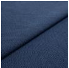
Blues CS II 9606 Blue/Marine 1002154