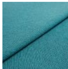
Blues CS II 9607 Light blue/Petrol 1002164