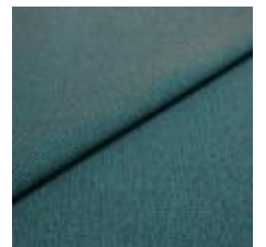
Blues CS II 9708 Petrol/Brown 1002165