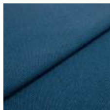
Blues CS II 9626 Blue/Ocean 1002168