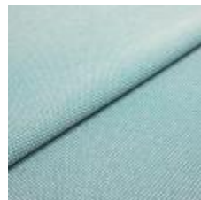
Blues CS II 9107 Turquoise/White 1002163