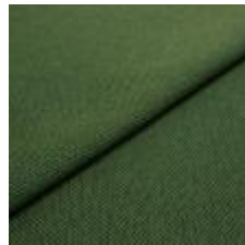
Blues CS II 9727 Grass/Forest 1002158