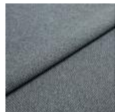
Blues CS II 9880 Grey/Grey 1002171