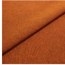
Blues CS II 9304 Orange/Red 1002150