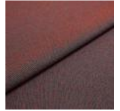
Blues CS II 9406 Red/Blue 1002153