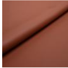
Illusion Full grain PU 23488 Rust 2002309