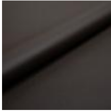
Illusion Full grain PU 48013 Chocolat 2002307