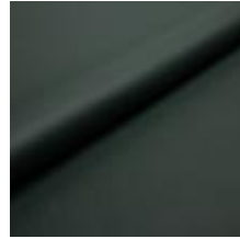
Illusion Full grain PU 77773 Dark green 2002310