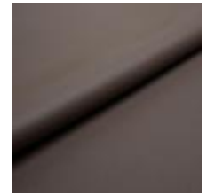
Illusion Full grain PU 47124 Caribou 2002306