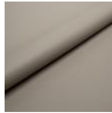
Illusion Full grain PU 87241 Taupe 2002304