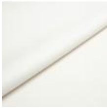
Illusion Full grain PU 80007 Coconut 2002301