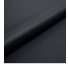
Illusion Full grain PU 68523 Blueberry 2002312