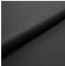
Illusion Full grain PU 59259 Antracit 2002314