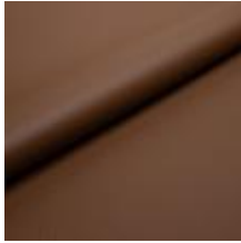
Illusion Full grain PU 44388 Dark Camel 2002308