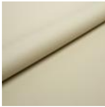
Illusion Full grain PU 81105 Blonde 2002302