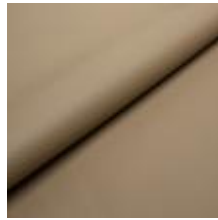
Illusion Full grain PU 86490 Latte 2002303