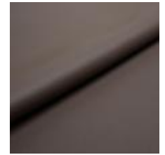
Illusion Full grain PU 47124 Caribou 2002306