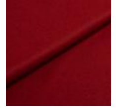
Wooly Trend 2301 Marsala 1039026