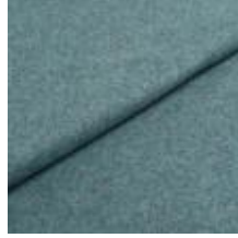
Wooly Plus 2288 Soda 1039024