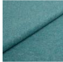
Wooly Trend 22882287 Aquamarin 1039031