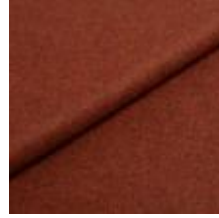
Wooly Trend 380037 Rust 1039025