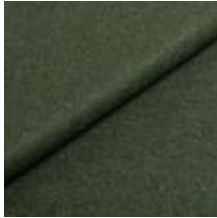
Wooly Trend 840069 Juniper 1039028