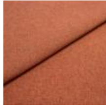
Rock CS 21 Rust 1028421