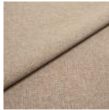
Rock CS 26 Beige 1028426