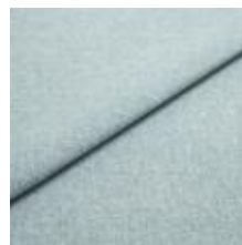
Rock CS 52 Sky 1028452