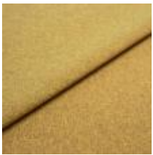
Rock CS 23 Olive 1028423