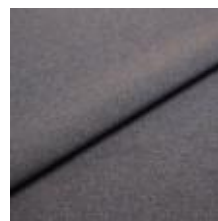
Rock CS 82 Melange blue 1028482