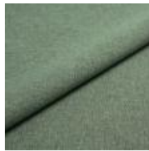
Rock CS 7512 Salvia 1028467