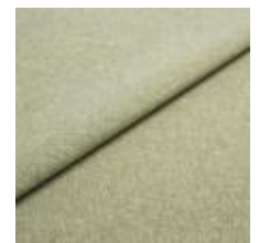
Rock CS 43 Cold green 1028443