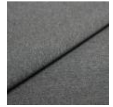
Rock CS 7 Stone 1028407