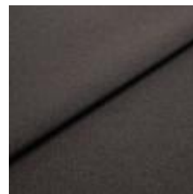
Rock CS 46 Coffee 1028446