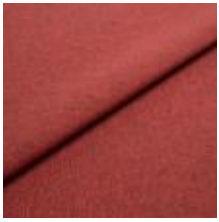
Rock CS 1 Red 1028401