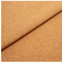
Rock CS 25 Curry 1028425