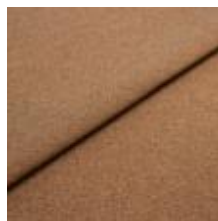
Rock CS 55 Papaya 1028455