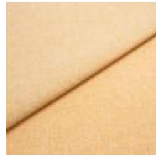
Rock CS 5 Wheat 1028405