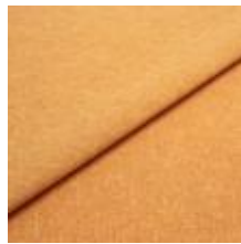
Rock CS 31 Terra 1028431