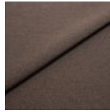
Rock CS 6 Nutmeg 1028406