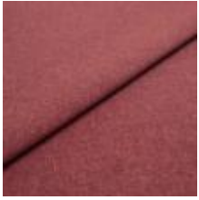
Rock CS 11 Pink 1028411