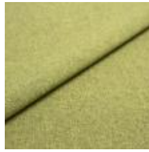
Rock CS 3 Leaf 1028403