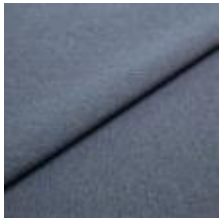
Rock CS 2 Midnight 1028402