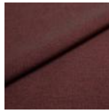
Rock CS 8514 Wine 1028465