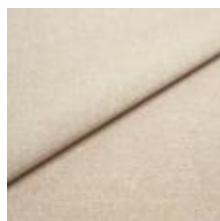
Rock CS 56 Desert 1028456