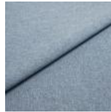
Rock CS 32 Denim 1028432