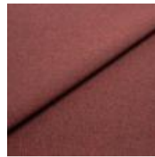
Rock CS 41 Wine 1028441