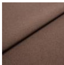
Rock CS 96 Java 1028496