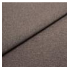
Rock CS 66 Jakaranda 1028466