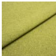
Rock CS 53 Lime 1028453