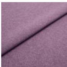
Rock CS 71 Lilac 1028471