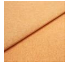
Rock CS 15 Apricot 1028415