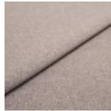
Rock CS 27 Silver 1028427