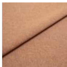
Rock CS 45 Frutti 1028445