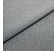
Rock CS 17 Steel 1028417