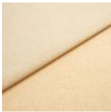
Rock CS 16 Sand 1028416