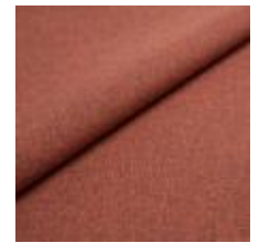
Rock CS 3012 Brick 1028463