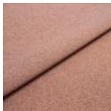
Rock CS 81 Soft pink 1028481