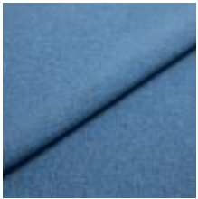
Rock CS 22 Ocean 1028422