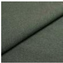
Rock CS 2517 Rosemary 1028468