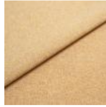
Rock CS 33 Straw 1028433