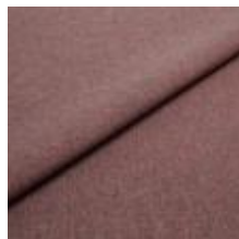
Rock CS 51 Beetroot 1028451