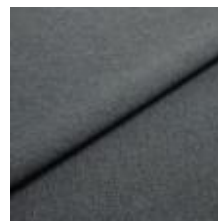
Rock CS 47 Antracit 1028447