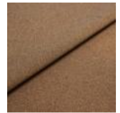
Rock CS 35 Bonfire 1028435