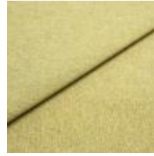
Rock CS 13 Plant 1028413