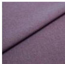
Rock CS 61 Cabaret 1028461