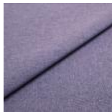
Rock CS 72 Violet 1028472