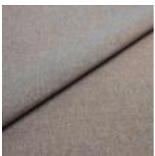
Rock CS 91 Mix purple 1028491