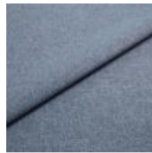
Rock CS 42 Lagoon 1028442