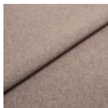
Rock CS 57 Tin 1028457