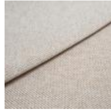
Pop CS 16 White beach 1027316