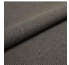
Pop CS 9222 Java 1027352