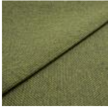
Pop CS 3 Garden 1027303