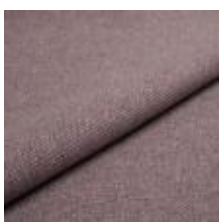
Pop CS 9215 Ametist 1027360