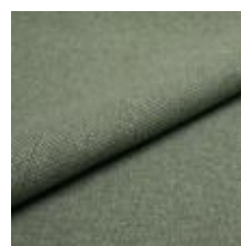
Pop CS 9227 Lily 1027363