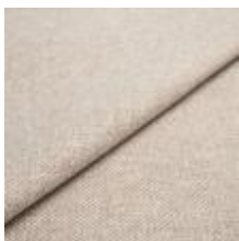
Pop CS 9202 Linen 1027354