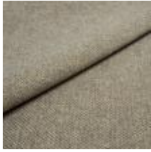
Pop CS 13 Green touch 1027313