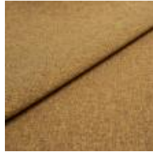
Pop CS 5 Curry 1027305