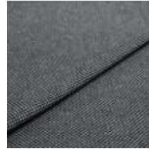
Pop CS 7 Stone 1027307