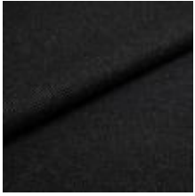
Pop CS 9808 Black 1027365