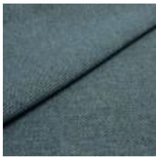
Pop CS 43 Lagoon 1027343