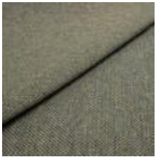
Pop CS 22 Skyfall 1027322