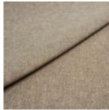
Pop CS 25 Frozen orange 1027325