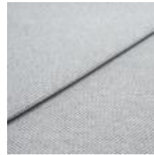
Pop CS 27 White silver 1027327