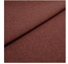
Pop CS 21 Brick 1027321