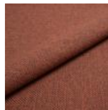
Pop CS 9312 Chipotle 1027357