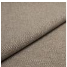
Pop CS 9212 Oak 1027353