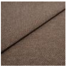
Pop CS 36 Latte 1027336