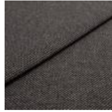
Pop CS 6 Double brown 1027306