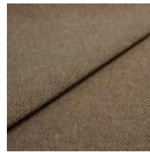
Pop CS 51 Sundown 1027351