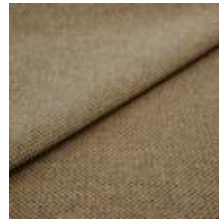
Pop CS 26 Caramel 1027326