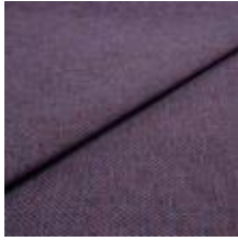
Pop CS 71 Violet 1027371