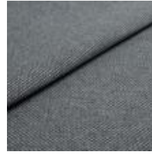
Pop CS 17 Lead 1027317