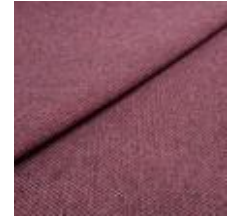
Pop CS 11 Sorbet 1027311