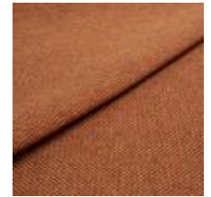
Pop CS 31 Terracotta 1027331