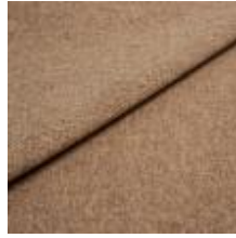
Pop CS 81 Apricot 1027381