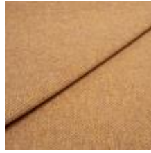
Pop CS 15 Peach 1027315