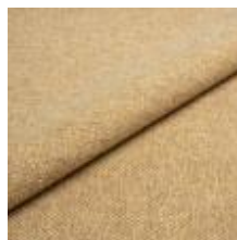
Pop CS 9203 Sunrise 1027355