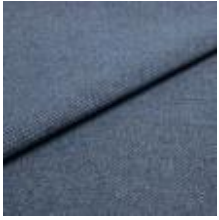
Pop CS 2 Blue melange 1027302