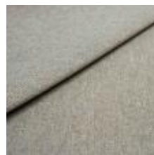
Pop CS 56 Wheat 1027356