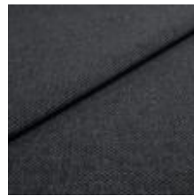
Pop CS 47 Graphite 1027347