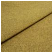
Pop CS 23 Golden green 1027323