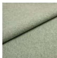
Pop CS 9217 Aventurine 1027362