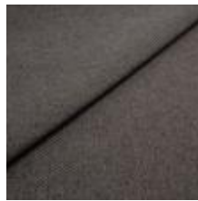
Pop CS 46 Coffee 1027346