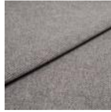
Pop CS 91 Frost 1027391