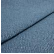
Pop CS 12 Heaven 1027312