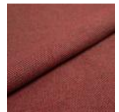
Pop CS 9412 Marsala 1027358