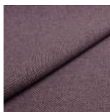
Pop CS 9205 Purple 1027361