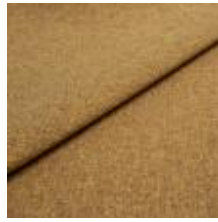
Pop CS 5 Curry 1027305