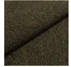
Barnum 9 Pine 1025007