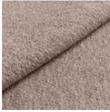
Barnum 3 Hemp 1025009