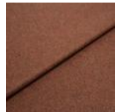
Margrethe 21140037 Brick 1020626