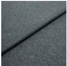
Margrethe 22800706 Marine melange 1020615