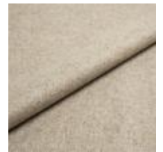
Margrethe 631 Marble 1020632