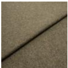
Margrethe 711010 Avocado 1020621