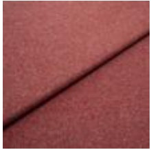
Margrethe 8 Aubergine 1020608