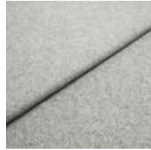
Margrethe 2 Silver melange 1020611