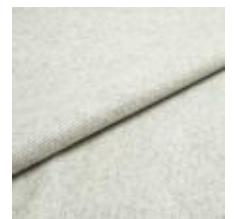
Margrethe 637 Limestone 1020638