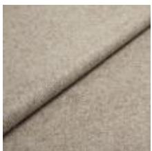
Margrethe 632 Feather 1020633