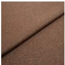
Margrethe 720037 Rusty 1020627