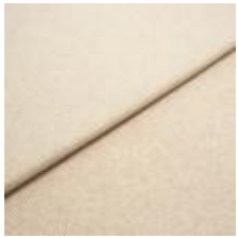
Margrethe 1 Sand 1020601