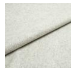
Margrethe 637 Limestone 1020638