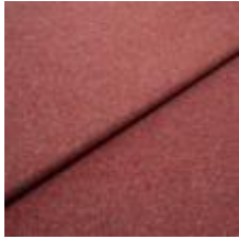
Margrethe 8 Aubergine 1020608