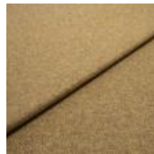
Margrethe 23162267 Umber 1020623