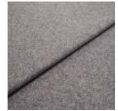
Margrethe 12 Violet 1020606