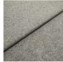
Margrethe 13 Stone 1020612