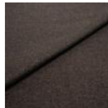
Margrethe 22802114 Night 1020624