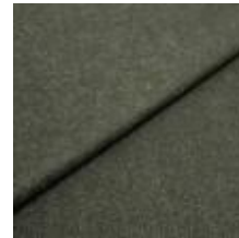
Margrethe 721010 Bottle green 1020619