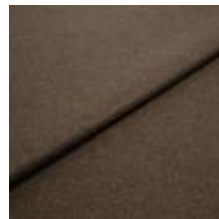
Margrethe 21141010 Java 1020629