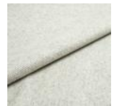
Margrethe 637 Limestone 1020638