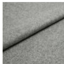
Margrethe 634 Mouse 1020635