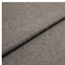
Margrethe 633 Havana 1020634