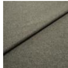
Margrethe 722318 Dusty green 1020618