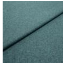
Margrethe 22800082 Pacific 1020617