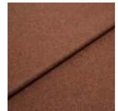
Margrethe 21140037 Brick 1020626