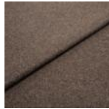
Margrethe 15 Dark brown 1020603