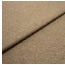
Margrethe 6 Bronze 1020602