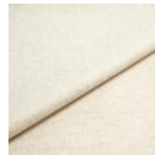
Margrethe 630 Ivory 1020631