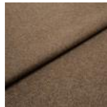
Margrethe 712114 Dark taupe 1020630