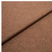
Margrethe 710037 Brandy 1020628