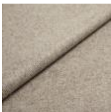
Margrethe 632 Feather 1020633