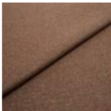
Margrethe 720037 Rusty 1020627