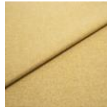
Margrethe 9 Bright green 1020604