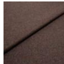
Margrethe 22800037 Wine melange 1020625