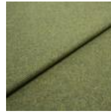
Margrethe 10 Green 1020605