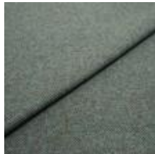
Margrethe 21140082 Lagoon melange 1020616