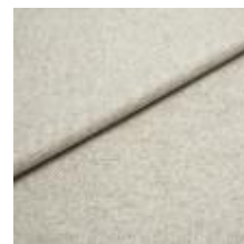
Margrethe 636 Griffin 1020637