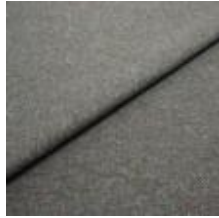
Margrethe 4 Petrol 1020609