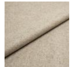
Margrethe 631 Marble 1020632