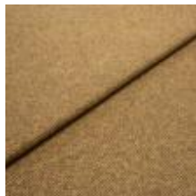
Margrethe 23162114 Amber 1020622