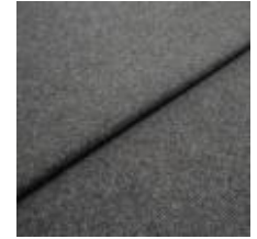
Margrethe 16 Antracit 1020613