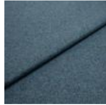
Margrethe 14 Ocean 1020610