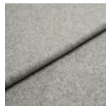
Margrethe 651 Dove 1020636