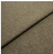
Margrethe 711010 Avocado 1020621