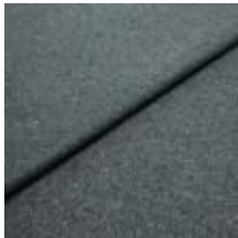
Margrethe 22800706 Marine melange 1020615