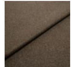
Margrethe 722114 Barque 1020620