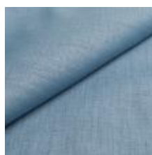
Lido trend 103 Sky 1017506