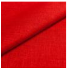
Lido 41 tulip 1017141