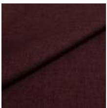
Lido 71 plum 1017171