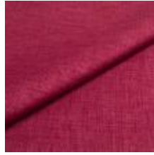
Lido 11 pink 1017111