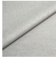
Lido 27 silver 1017127