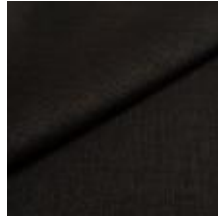
Lido trend 126 Onyx 1017556