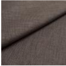
Lido trend 129 Savile grey 1017554