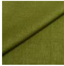
Lido 3 green 1017103