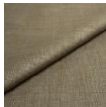
Lido trend 134 Antique green 1017537