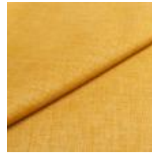
Lido 5 Sun 1017105