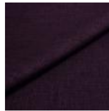
Lido 51 lilac 1017151