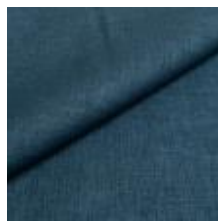
Lido 121 blue 1017183