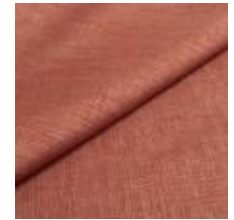
Lido trend 88 Terra 1017527