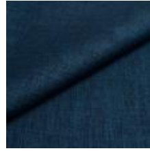
Lido 12 Ocean 1017112