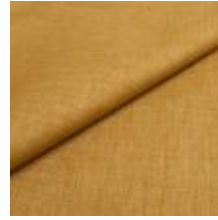
Lido 13 light green 1017113