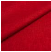
Lido 1 red 1017101