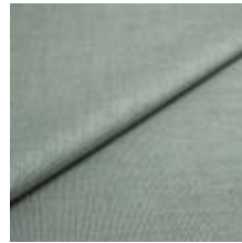
Lido trend 93 Aqua 1017524