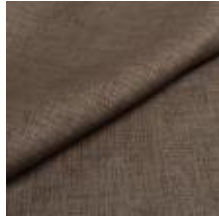
Lido trend 128 Typhoon 1017555