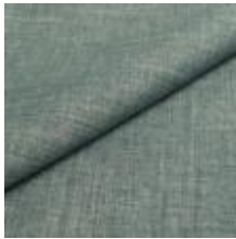
Lido trend 99 Crystal 1017522