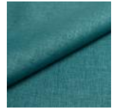
Lido 32 turquoise 1017132