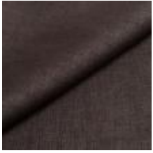
Lido 7 graphite 1017107