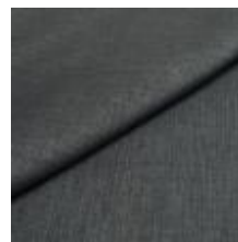
Lido trend 100 Lagoon 1017502