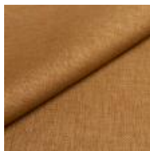
Lido trend 155 Lemongrass 1017536