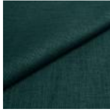
Lido trend 137 Wave 1017549