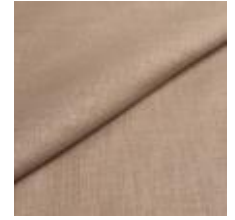
Lido 16 beige 1017116