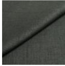
Lido trend 142 Gale 1017550