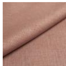
Lido trend 148 Orchid 1017543