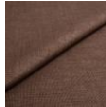
Lido trend 76 Havana 1017525