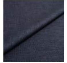
Lido trend 136 Power blue 1017552