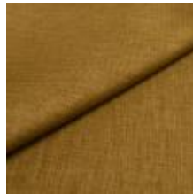
Lido 23 olive 1017123