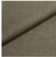
Lido trend 95 Mineral 1017523