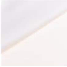
Lido 10 cocos 1017110