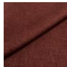
Lido trend 145 Nocturne 1017545