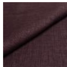
Lido trend 144 Thistle 1017544