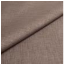
Lido 17 concrete 1017117