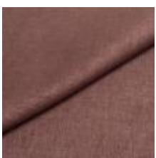
Lido trend 89 Heather 1017504