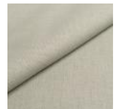
Lido trend 143 Mint 1017546