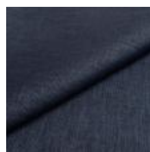
Lido trend 104 Night 1017507