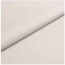
Lido trend 133 Ice white 1017553