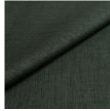
Lido trend 140 Storm 1017551