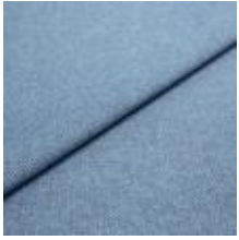
Jazz CS 2 Sky 1013702