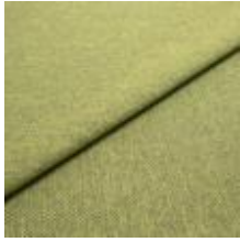
Jazz CS 3 Green 1013703