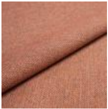
Jazz CS 9322 Apricot 1013755