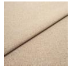
Jazz CS 26 Beige 1013726