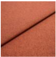
Jazz CS 21 Brick 1013721