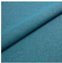
Jazz CS 9612 Petrol 1013761