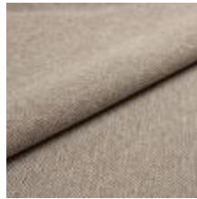
Jazz CS 9202 Latte 1013753