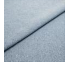
Jazz CS 12 Ice 1013712