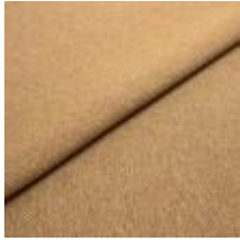
Jazz CS 15 Terra 1013715