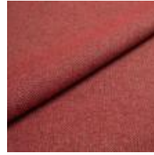
Jazz CS 9412 Marsala 1013757