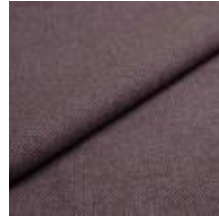
Jazz CS 9205 Ametist 1013758