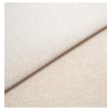
Jazz CS 16 White beach 1013716