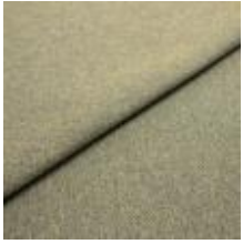
Jazz CS 13 Light green 1013713