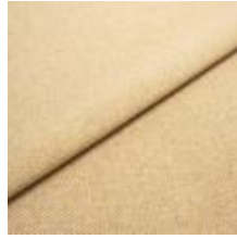
Jazz CS 5 Wheat 1013705