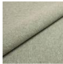
Jazz CS 9217 Aventurine 1013759