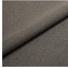
Jazz CS 9212 Java 1013752