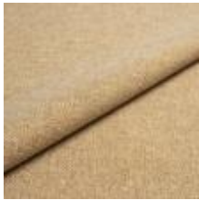
Jazz CS 9203 Oats 1013754