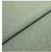
Jazz CS 23 Cool green 1013723