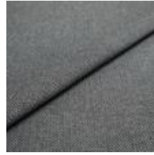
Jazz CS 7 Stone 1013707