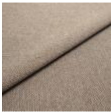
Jazz CS 36 Brown melange 1013736