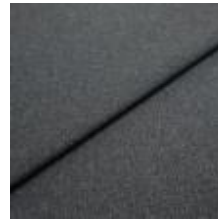
Jazz CS 47 Night 1013747