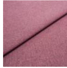
Jazz CS 11 Pink 1013711