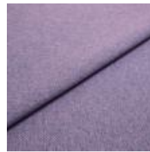
Jazz CS 51 Lavender 1013751