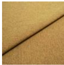
Jazz CS 33 Olive 1013733