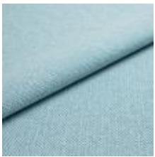
Jazz CS 9616 Turquoise 1013762