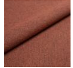
Jazz CS 9312 Chipotle 1013756