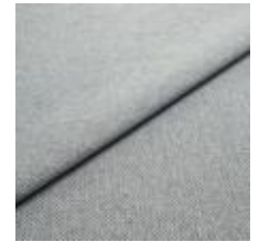
Jazz CS 17 Steel 1013717