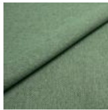
Jazz CS 9702 Emerald 1013760