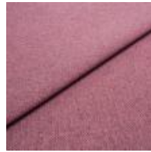
Jazz CS 11 Pink 1013711