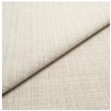
Funk CS 9106 beach 1008501