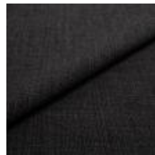
Funk CS 9810 charcoal 1008529