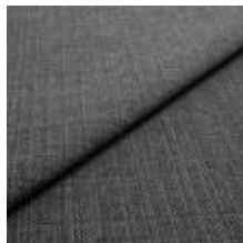
Funk CS 9806 granite 1008527