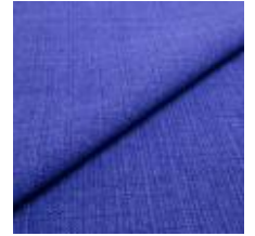
Funk CS 9605 violet 1008512