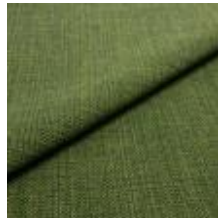
Funk CS 9715 garden 1008516