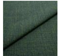
Funk CS 9721 pike 1008518