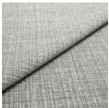
Funk CS 9801 lead 1008525