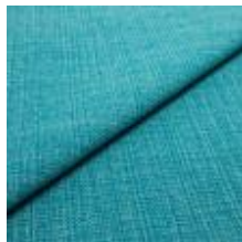
Funk CS 9704 pacific 1008521