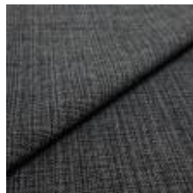
Funk CS 9808 stone 1008528