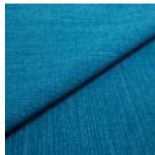
Funk CS 9706 petrol 1008522