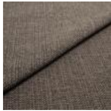
Funk CS 9212 latte 1008503