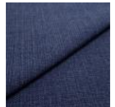
Funk CS 9613 navy 1008524