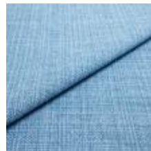
Funk CS 9603 sky 1008523