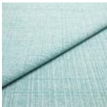
Funk CS 9701 fresh 1008520