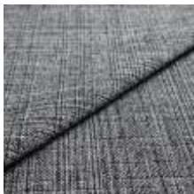
Funk CS 9804 pepper 1008526