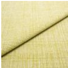
Funk CS 9711 avocado 1008514