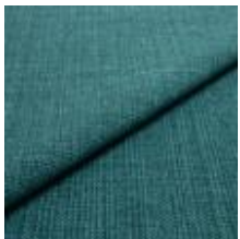
Funk CS 9708 laguna 1008519