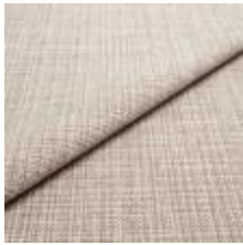
Funk CS 9112 caramel 1008502