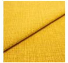
Funk CS 9307 Saffron 1008506