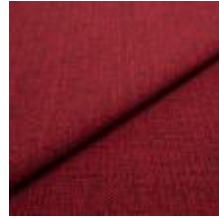
Funk CS 9407 wine 1008511