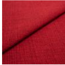
Funk CS 9405 rouge 1008510