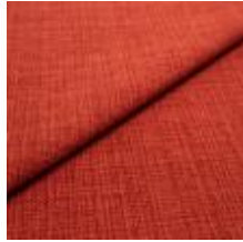
Funk CS 9403 brick 1008509