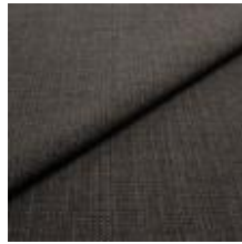
Funk CS 9216 coffee 1008504