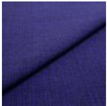
Funk CS 9611 purple 1008513