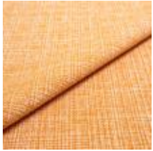
Funk CS 9311 peach 1008507