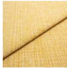
Funk CS 9301 wheat 1008505