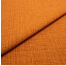
Funk CS 9314 rust 1008508