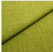
Funk CS 9713 leafes 1008515