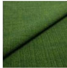
Funk CS 9719 grass 1008517