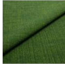
Funk CS 9719 grass 1008517