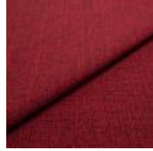
Funk CS 9407 wine 1008511