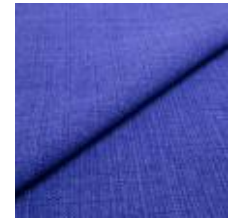
Funk CS 9605 violet 1008512