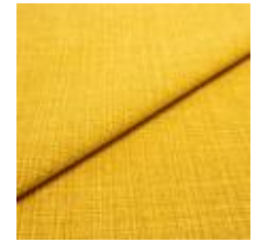
Funk CS 9307 Saffron 1008506