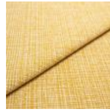
Funk CS 9301 wheat 1008505