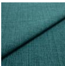
Funk CS 9708 laguna 1008519