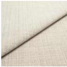
Funk CS 9106 beach 1008501