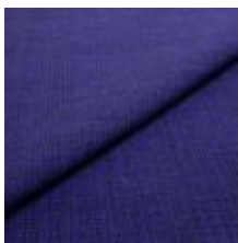
Funk CS 9611 purple 1008513