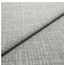
Funk CS 9801 lead 1008525