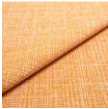
Funk CS 9311 peach 1008507