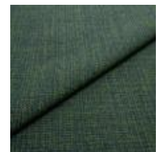
Funk CS 9721 pike 1008518