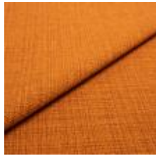
Funk CS 9314 rust 1008508