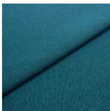
Blues CS II 9636 Blue/Petrol 1002166