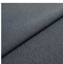
Blues CS II 9818 Antracite/Grey 1002172