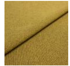
Blues CS II 9317 Gold/Black 1002147