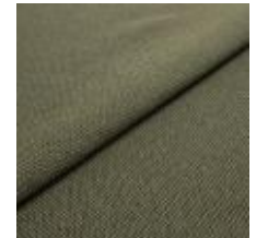
Blues CS II 9737 Olive/Olive 1002159