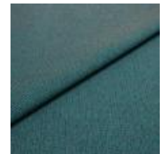
Blues CS II 9708 Petrol/Brown 1002165