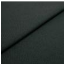
Blues CS II 9207 Bottlegreen/Brown 1002160