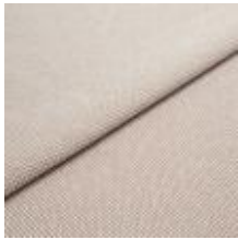
Blues CS II 9122 Beige/Sand 1002142