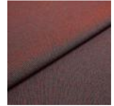
Blues CS II 9406 Red/Blue 1002153