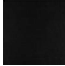
Vintage Black Soft Anilina 1100421