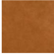
Vintage Cognac 1100413