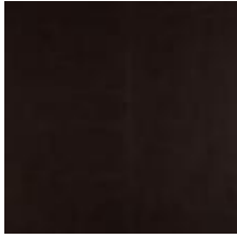
Vintage Dark Chocolate 1100412