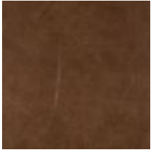
Vintage Tabacco 1100431