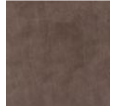
Vintage Concrete 1100429