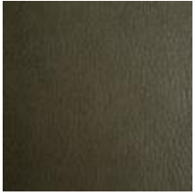
Vintage Olive 1100411