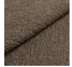
Barnum 8 Medium green 1025013