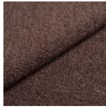
Barnum 11 Brown 1025005