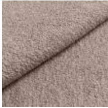
Barnum 3 Hemp 1025009