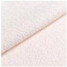
Barnum 1 Off white 1025001