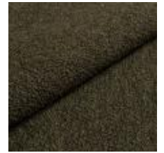
Barnum 9 Pine 1025007