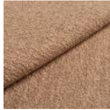
Barnum 4 Juta 1025011