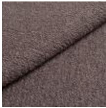
Barnum 12 Warm grey 1025002