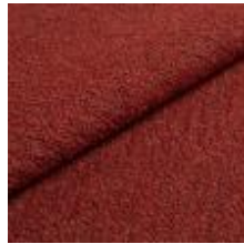
Barnum 23 Rust 1025016