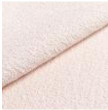
Barnum 24 Lana 1025015