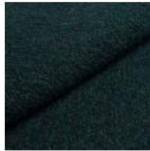
Barnum 20 Petrol 1025017