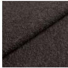
Barnum 13 Antracit 1025003