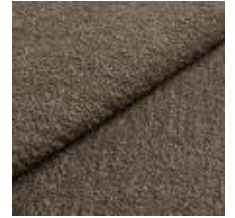
Barnum 8 Medium green 1025013