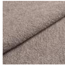
Barnum 14 Silver 1025006