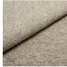
Barnum 2 Sand 1025012