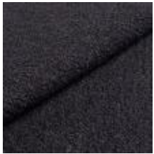
Barnum 19 Ocean 1025014