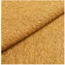
Barnum 5 Ocher 1025008