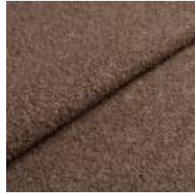
Barnum 10 Dark taupe 1025010