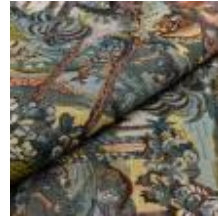
Nostalgi Riddare 1023905