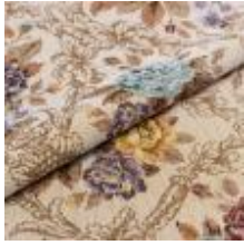
Nostalg Ramme 1023902