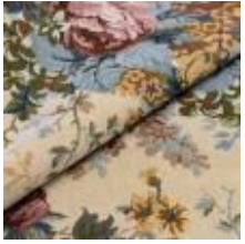
Nostalgi Rose 1023901