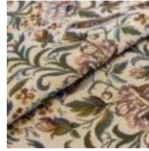
Nostalgi Lövsångare 1023906