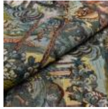
Nostalg Riddare 1023905