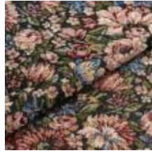
Nostalgi Blomsteräng 1023903