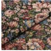
Nostalg Blomsteräng 1023903