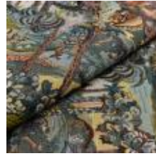
Nostalgi Riddare 1023905